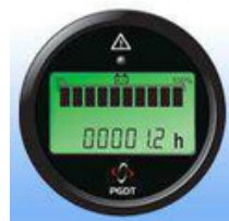
Indicador de Carga e Conta-Horas (S)