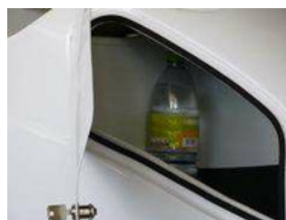
Caixa de Arrumos Pessoais (S)