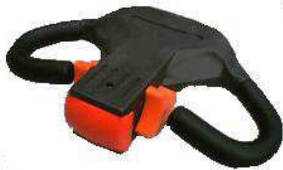
Comando da Tracção/Direcção é o mesmo quer o Operador esteja Transportado ou a Pé (S)