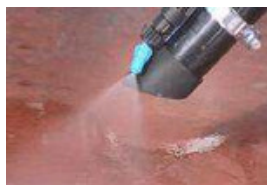
Kit de Lavagem e de Dejectos Caninos (O)