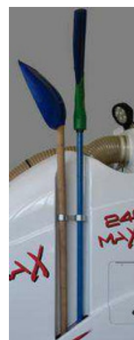
Suporte Vassoura e Pá (O)