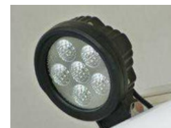
Luz de Trabalho LED (O)