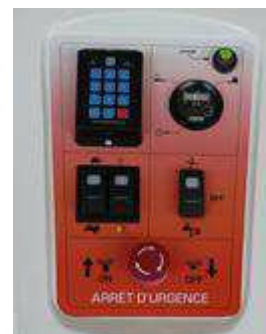
Comando Geral Simples (S)