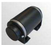
Vibração Eléctrica para Limpeza Automática do Filtro (O)