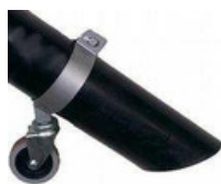
Roda de Apoio do Tubo de Aspiração (O)