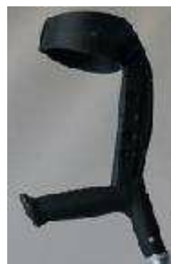
Punho e apoio Dextro/Canhoto (S)